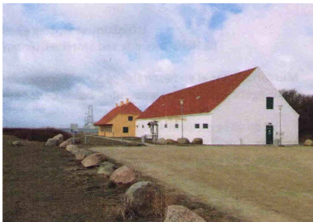
Isbådsmuseet på Halskov Odde Storebæltsvej 122, 4220 Korsør

URL: www.byogoverfartsmuseet.dk Mail: mail@byogoverfartsmuseet.dk Tlf: 58374755